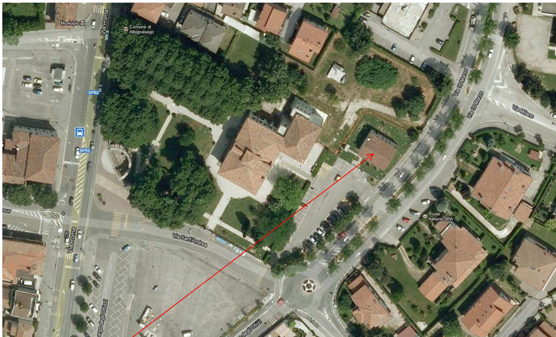
EX CASA BARATTO